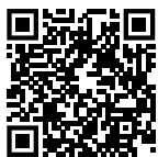
Å at jeg kunne - Storsalen minikor

Slik rytmen korresponderer med vår kropp, korresponderer musikkens harmoni med vårt følelsesliv. Den naturlige harmoni hører med til det skjønne og gode Gud har skapt. Se for deg et naturskjønt landskap som ånder av fred og ro, med de fineste stemninger i farge og lys. Mens et sydende og rastløst byliv, med ulyd og bråk, kaos og virvar, kan rive sinnet opp, kan en fin naturopplevelse skape ro i et opprevet sinn.