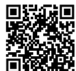
Agni Parthene - gresk ortodoks