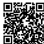
Motet Jesu, meine Freude - J. S. Bach

Slik rytmen korresponderer med vår kropp og harmonien med vårt følelsesliv, korresponderer melodien med vårt åndsliv. Melodien er det element som får musikken til å bevege seg framover. Den er utsagnet i musikken. Det har en viss likhet med språklige utsagn, ord satt sammen ved hjelp av kognitive, åndelige prosesser - til meningshelheter. Melodien taler til oss som åndelige, intellektuelle vesener.